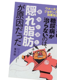
参考文献:「やせない、糖尿病が治らないのは、筋肉に潜む隠れ脂肪が原因だった」栗原毅著/主婦の友インフォス発行

認知症を防ぐためには、日ごろから糖質ちよいオフ・ダイエットを実践し、スロースクワットなどの運動習慣を身につけることが有効です。