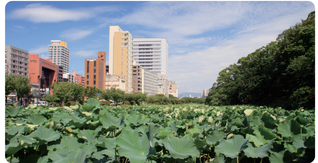
↑舞鶴公園には福岡城跡のお濠があり、これからの季節はハスの花が一面に咲きます。

昨年の夏頃から和食の料理教室に通い始めました。少人数の教室なので、先生の目が行き届いていて、けっこう緊張感があります…。