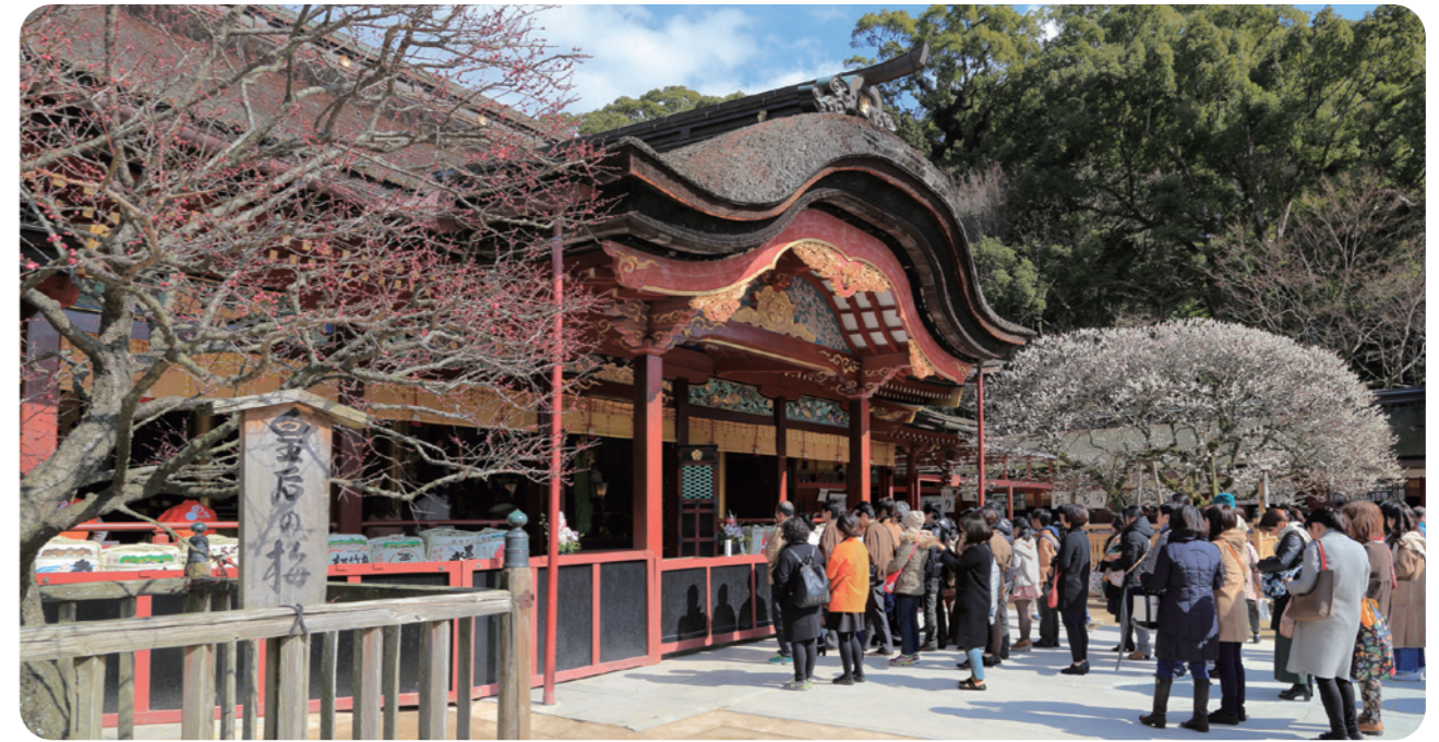
↑太宰府天満宮の御本殿。手前の梅が「皇后の梅」、奥の梅が「飛梅」です。

1月末、東京ビッグサイトで開催された健康博覧会に出展しました。国内最大級の健康産業BtoB商談展に、今回は開発して間もないカメリナオイルサプリを多くの方に知っていただくのに良い機会だと思い、出展を決めました。