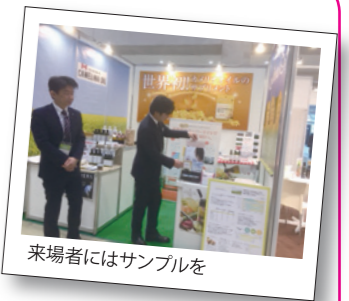
来場者にはサンプルを

あっという間に3日間が過ぎました。今回は他のブースを見学する余裕はありませんでしたが、注目を浴びているブースから世の中の流れを感じることができました。その中に「次世代健康サービス」をテーマにしたブースがあり、健康管理システムや脳活商材が挙げられていました。超高齢社会に突入し「健康寿命の延伸」は健康産業全体で取り組む課題なのだ痛感しました。弊社もしっかり取り組んでいきたいと強く思ったのでした。