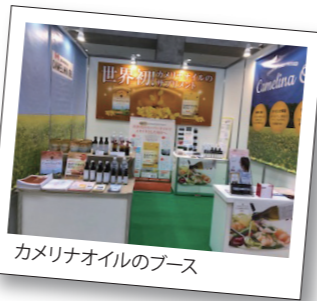
カメリナオイルのブース

健康博覧会の来場者は、小売業・卸業・商社・メーカーなど様々。皆さん、責任者や担当者といった商談