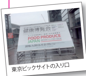
東京ビッグサイトの入り口